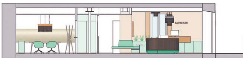
Schnitt • Section