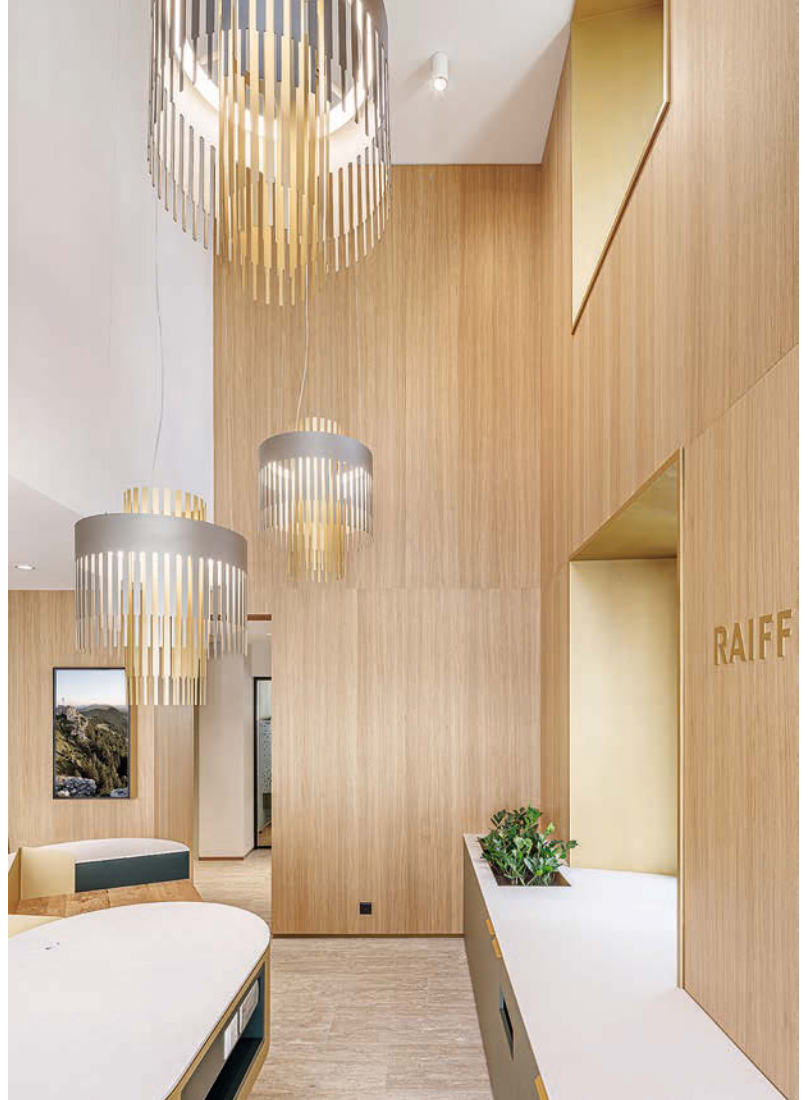
... erinnernden Leuchtschirme in unterschiedlicher Ausführung. • ... of the spring lamellas of cylinder music boxes.

Dank einer mobilen Trennwand kann der SB-Bereich außerhalb der Öffnungszeiten abgetrennt werden. • Thanks to a mobile partition wall, the self-service area can be separated outside opening hours.