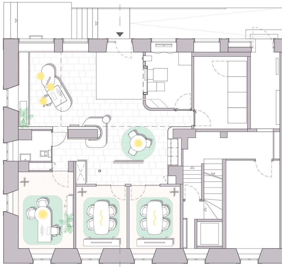
Grundriss • Floor plan