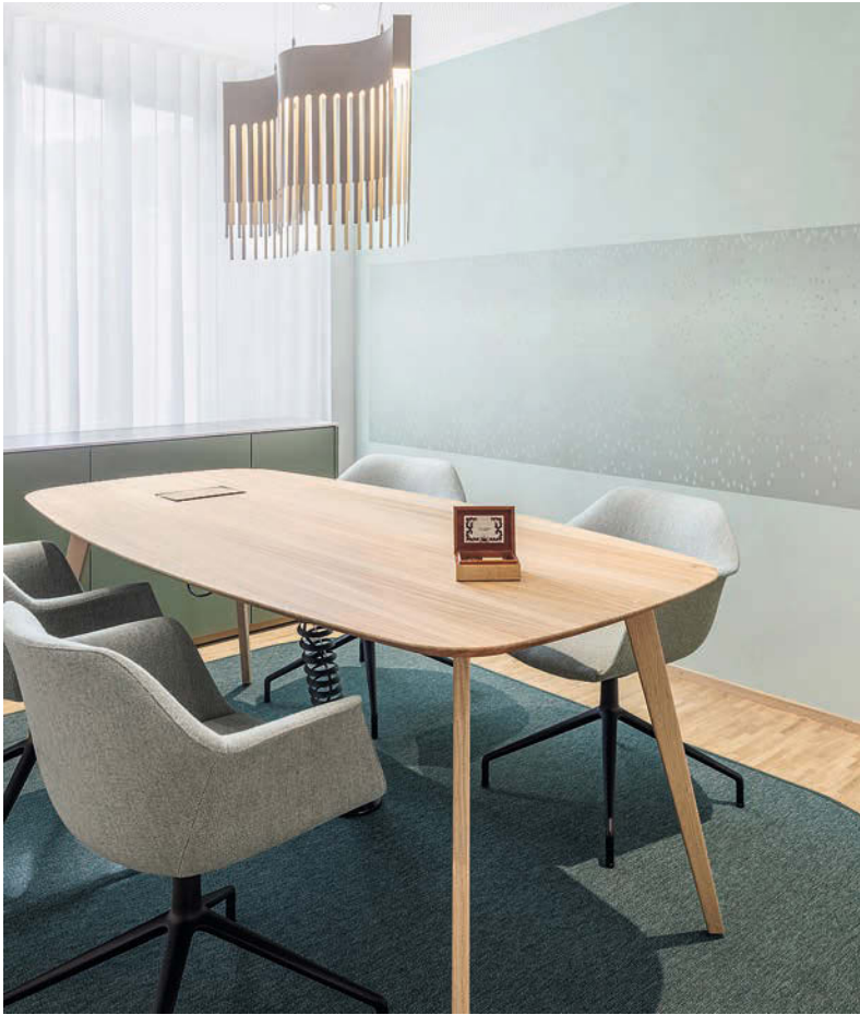
Allgegenwärtig: die an Federlamellen von Walzenspieluhren ... • Lampshades in various designs reminiscent ...